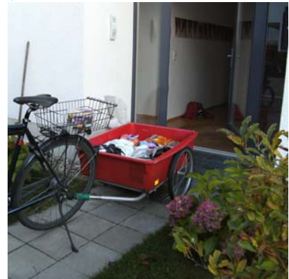
Großer Einkauf Abladen direkt vor Haustür