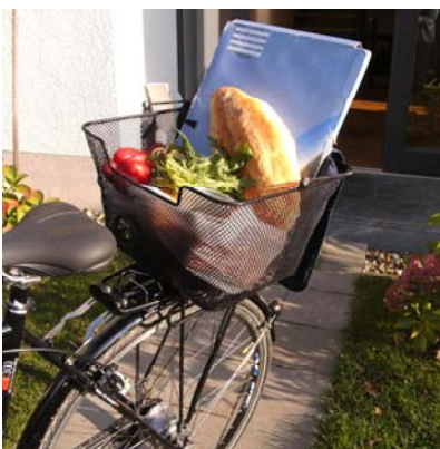
Kleiner Einkauf auf dem Arbeitsweg der immer frisch ohne Zeitaufwand