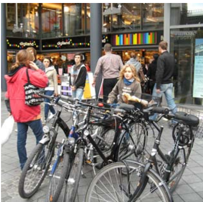
Parkplatz immer direkt vor der Ladentür „Öffentlichen“