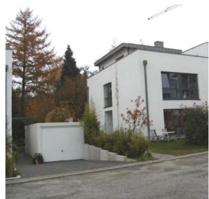
Platz ohne Ende Sitzplatz auf dem Rasen, statt Garage vor dem Fenster