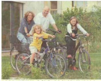
„In der Stadt macht ein Auto keinen Sinn“ Aus Platz-, Kraft-, Zeit-, Geld- und Umweltgründen bevorzugt Familie Christfreund seit Jahren das Fahrrad und meint: „Für uns ist das ein Gewinn.“