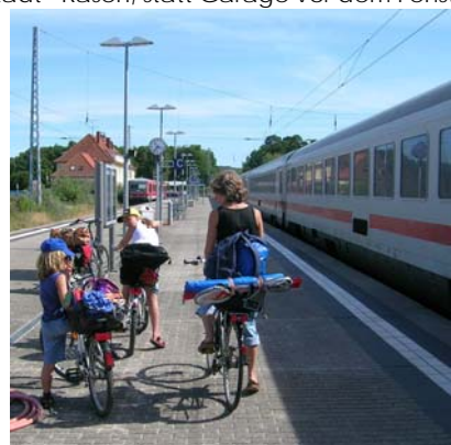
Urlaub mit den