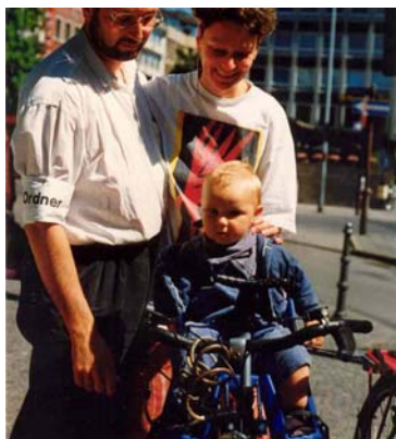
Kleine Kinder ohne Parkplatzsuche und Verstauben von Kinderwagen schnell in die Stadt