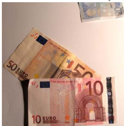
Kosten Radeln spart soviel Geld