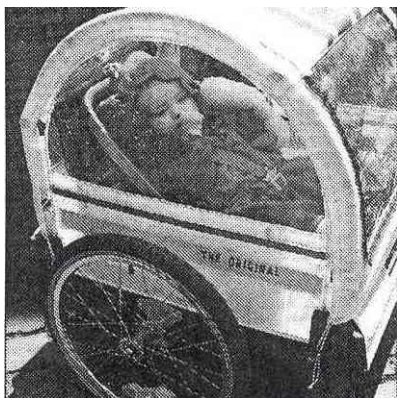
Ganz kleine Kinder

leise, giftfrei, schnell, preiswert und Raum sparend immer am Stau vorbei